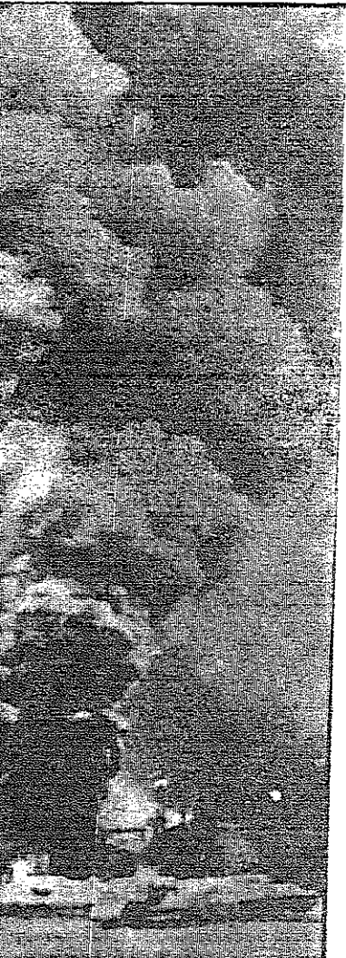
كارثة منجم في ويست فرجينيا